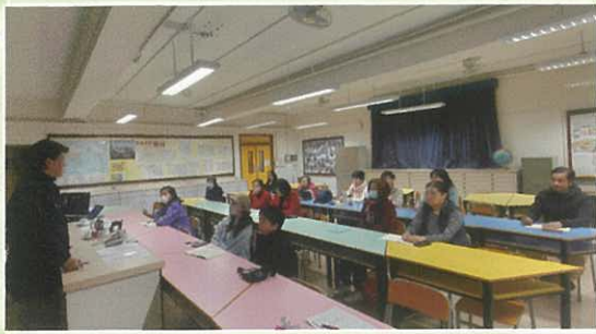
佛化科 - 生命盛筵佛學班