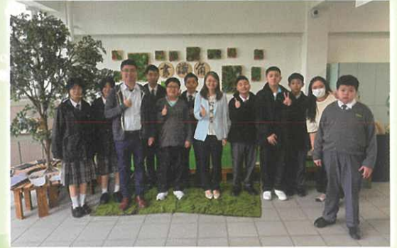
中文科 - 書識角作家巡禮