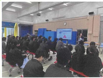
未來的世界工作講座