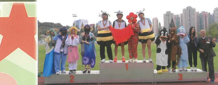
體育科 - 陸運會校友接力賽、小學邀請賽、趣味造型競技比賽