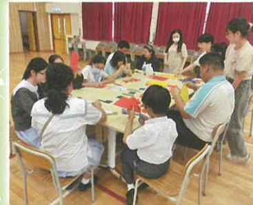
中文科 - 中秋剪紙