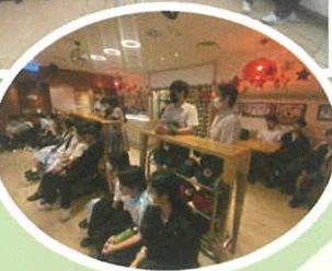
康樂場地管理業參觀 香港鄉村俱樂部