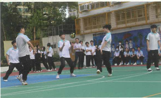
體育科及訓輔組 - 師生閃避球活動