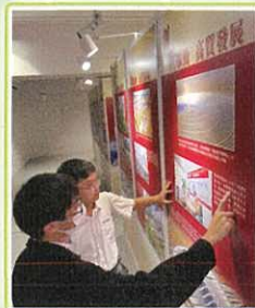
豐功偉業 - 中華人民共和國成立75周年 輝煌成就 圖片精粹巡迴展覽 (大埔區)