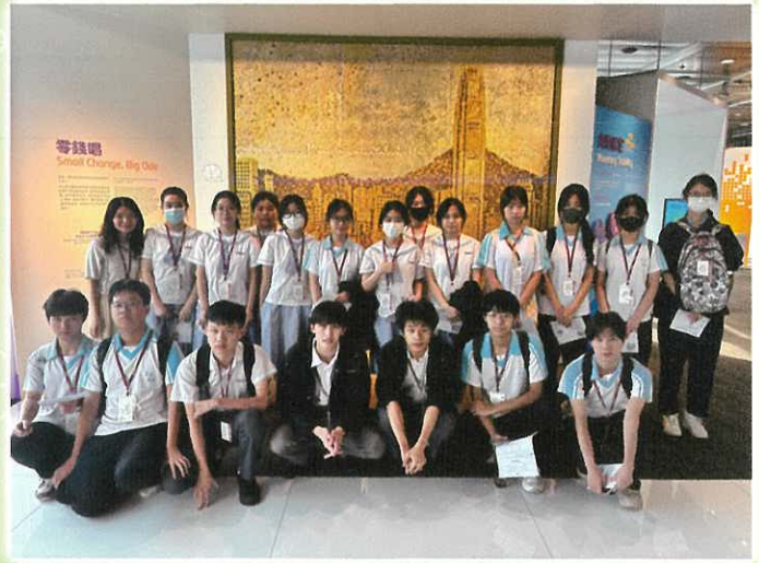
經濟科 – 參觀金融管理局