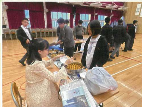
家政科 – 生活添煮意活動