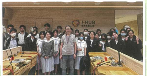
參觀J-Hub香港珠寶工坊