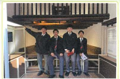
參觀三棟屋博物館