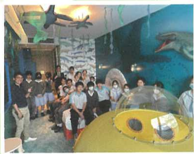
參觀香港富麗敦海洋公園酒店