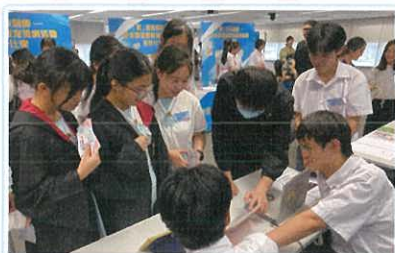
教育局舉辦之「諾」活策劃師—— 校本價值觀教育推廣活動設計比賽 (中學) 季軍