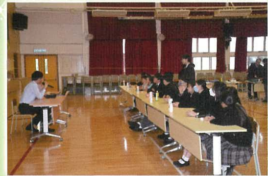
科學科 – 常識問答比賽