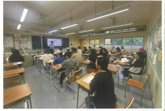
多元出路家長講座