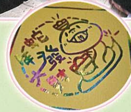
製作燙金揮春、 印刷金蛇利是封及 正能量賀年創作