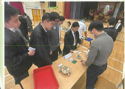
科技科 - 電腦繪圖與鐳射切割