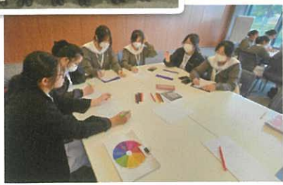
課外活動組及生涯規劃組-明日女菁領袖會