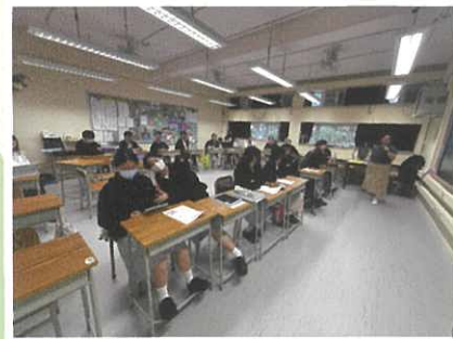
模擬面試體驗活動