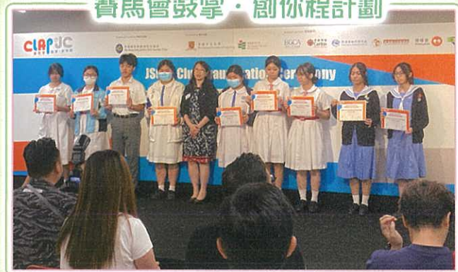
賽馬會鼓掌·創你程計劃