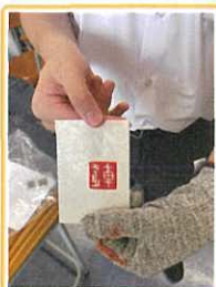
賽馬會「傳·創」非遺教育計劃 - 印章雕刻