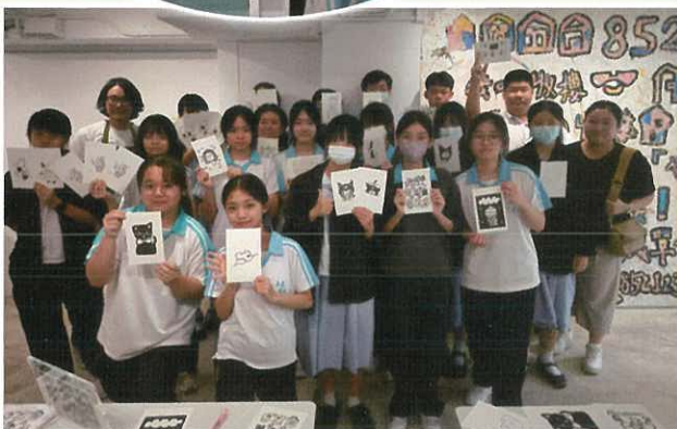
視覺藝術科 – 絲網印刷工作坊