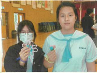
體藝領域活動 - 創藝扭扭棒