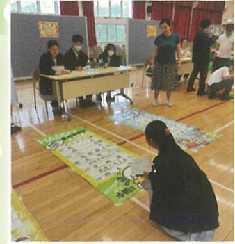
中文科 - 滾滾樂迎中秋