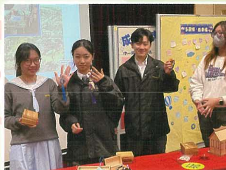
中史科 – 中國生活大百科活動