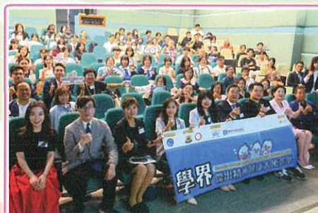
學界精神健康大使選舉開幕禮