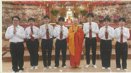
佛化科 - 供佛齋天獻供儀式