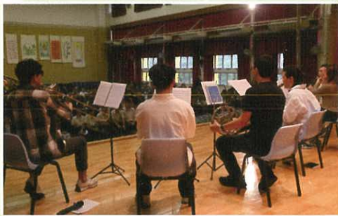
音樂科 – 管樂簡介及欣賞會