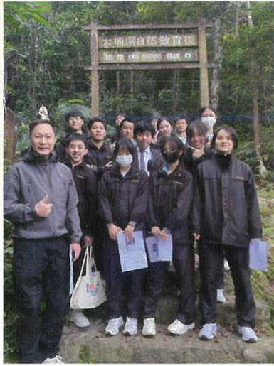
地理科 – 松仔園考察及米埔紅樹林生態研究

本校舉辦各類活動及安排學生參與不同比賽，豐富其課外知識，並獲得實踐課堂所學的機會。學生在各項活動中各展所長，包括策劃活動及擔任司儀，從而提升其組織及協作的技能。同學在老師的引導下反思所學，為未來的成功奠下基礎。