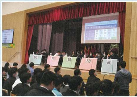
《憲法》和《基本法》問答比賽

本校十分重視德育及國民教育的培育。德育方面，尤其重視精神健康及正向生活態度，透過舉辦講者分享及體驗，從「愛自己」、「愛生命」出發，加上國學「禮」與「孝」的薰陶，再輔以禁毒、資訊素養等主題活動，全面提升學生的正能量及正向價值觀，完美人格，以備生活上各項挑戰。與此同時，本校師生透過各種不同體驗及參觀，認識國家發展及文化遺產，好讓師生均以國家文明進步及成就感到自豪，提升國民身分認同。