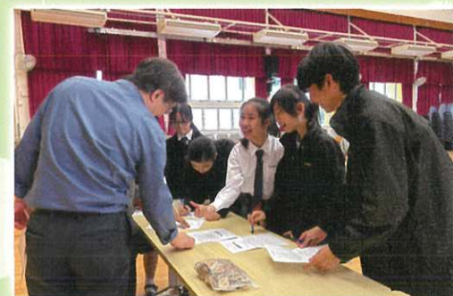
數學科 – 智趣 IQ 至多 FUN