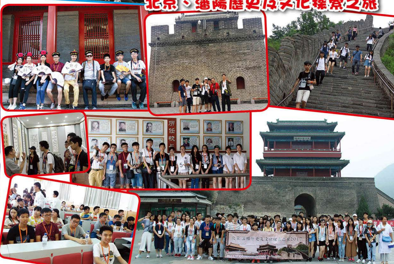
北京瀋陽歷史及文化探索之旅2017