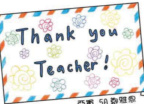
亞軍 5A 鄭雅恩