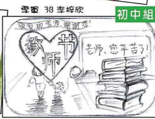
季軍 3B 李梓欣