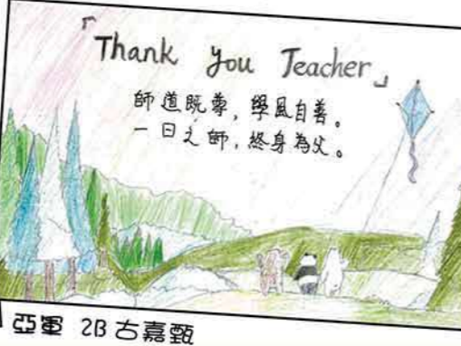
亞軍 2B 古嘉甄