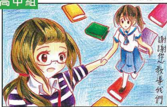
冠軍 5C 梁祉瑜