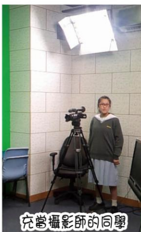
充當攝影師的同學