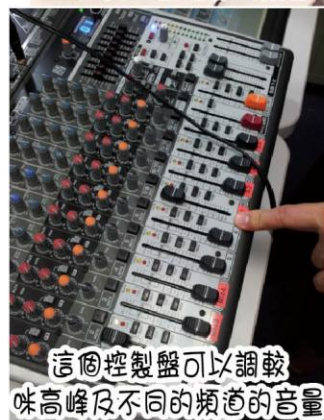
這個控制盤可以調整音高峰及不同的頻道的音量