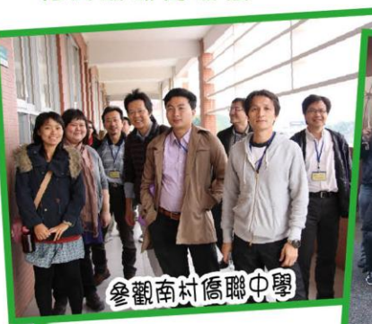
參觀南村僑聯中學