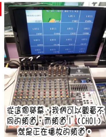
從這個螢幕，我們可以觀看不同的頻道，而頻道1 (CH01) 就是正在播放的頻道。