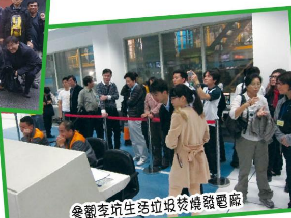
參觀李坑生活垃圾焚燒發電廠