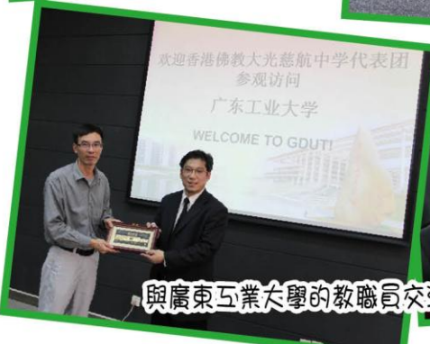
與廣東工業大學的教職員交流