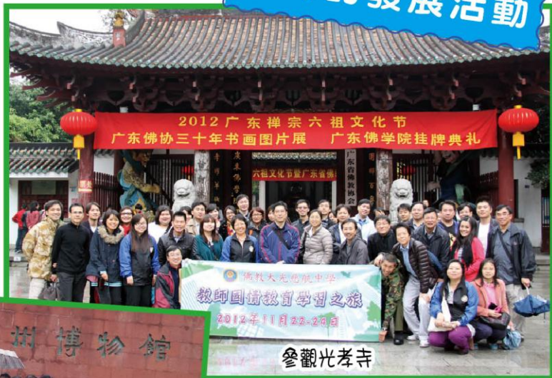
2012 广东禅宗六祖文化节 广东佛协三十年书画图片展 广东佛学院挂牌典礼