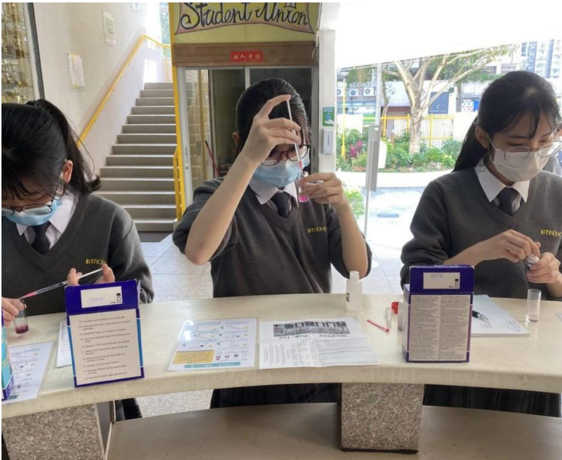
學生每周需使用試劑檢測水樣本中各離子濃度。