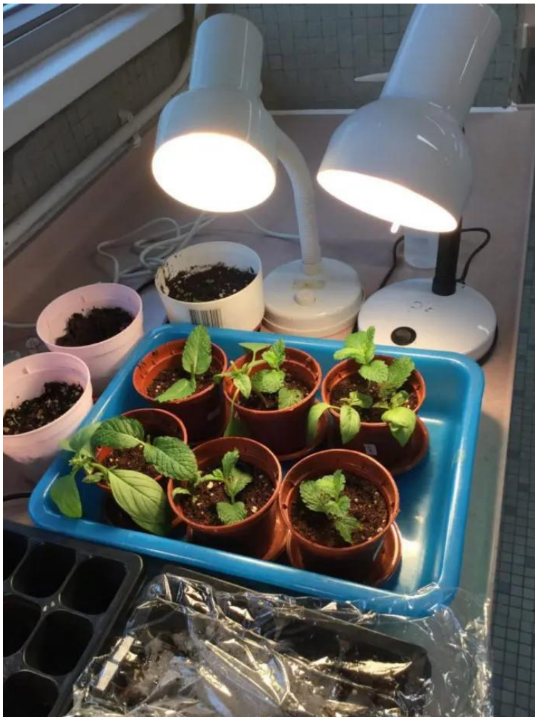
另一跨科活動是家政及生物科連繫推廣香草種植及煮食。