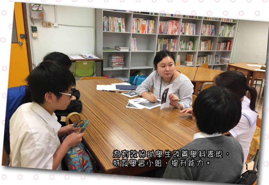
為有效協助學生改善學科表現，特設學習小組，提升能力。