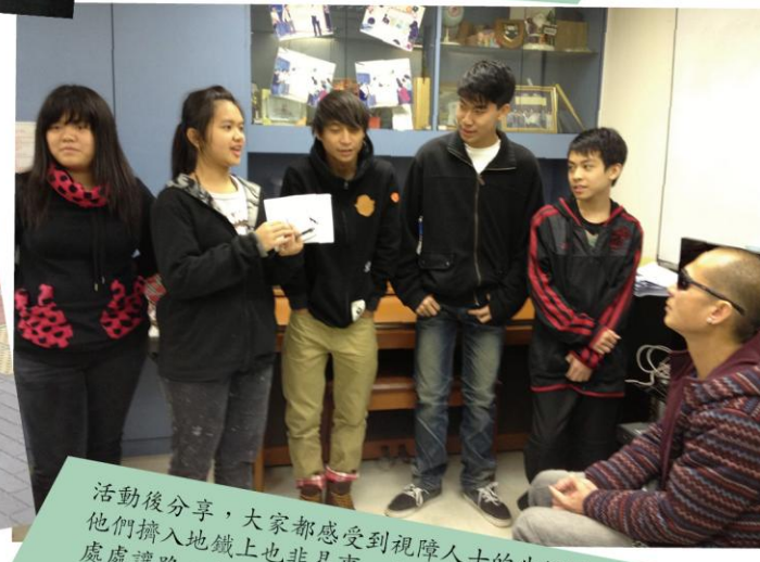
活動後分享，大家都感受到視障人士的生活情況，他們擠入地鐵上也非易事，幸好，香港人很有愛心，處處讓路，令視障人士可輕鬆享受逛街的樂趣。