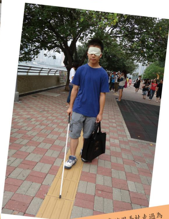
步行途中，我們嘗試用手杖走過為視障人士而設的引導徑。