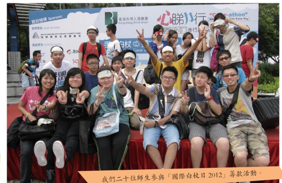
我們二十位師生參與「國際白杖日 2012」籌款活動。