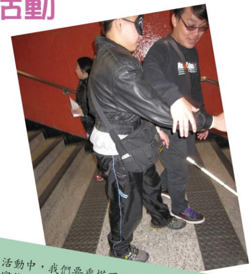
活動中，我們要乘搭不同的交通工具穿越鬧市去完成任務。