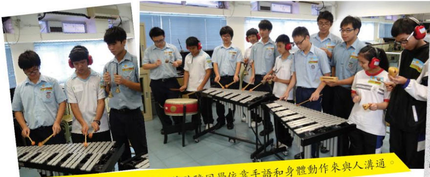
活動中我們戴著耳罩，體驗著聽障同學依靠手語和身體動作來與人溝通。