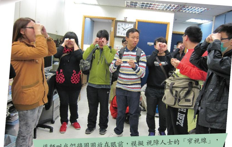
導師叫我們將圓圈放在眼前，模擬視障人士的「窄視線」，加深我們對視障的認識。