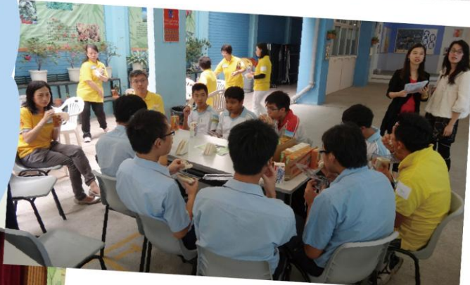
整日與聽障同學一起活動，他們縱有缺陷，但也能活得快樂。