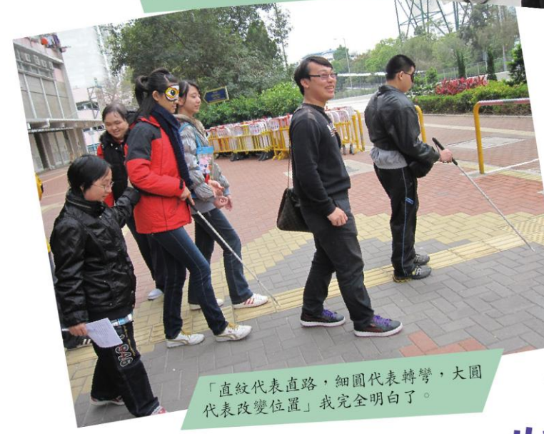
「直紋代表直路，細圓代表轉彎，大圓代表改變位置」我完全明白了。