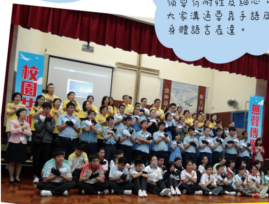
活動後我們成為了「共融大使」，肩負起推廣校園共融信息的使命。