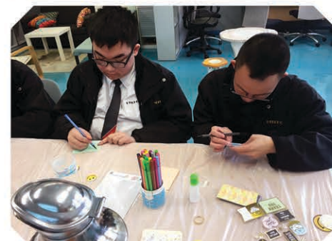
除了用心製作食物外，同學對咖啡廳的其他準備工夫也是一絲不苟。