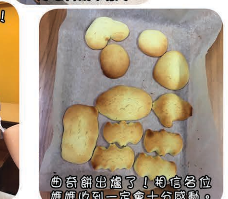
曲奇餅出爐了！相信各位媽媽收到一定會十分感動。