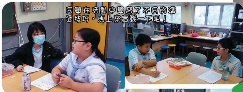
同學在活動中學習了不同的溝通技巧，馬上來嘗試一下吧！