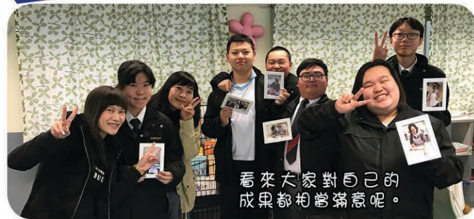
看來大家對自己的成果都相當滿意呢。