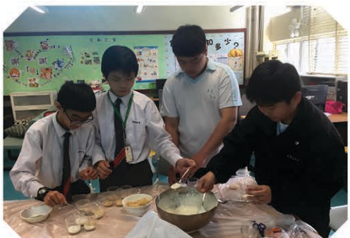
一點點的「合作」、一絲絲的「認真」，就是最佳的調味品。

「喜伴同行計劃」社交小組旨在讓同學學習個人行為如何影響別人對自己的印象。透過不同形式的小組訓練活動，協助同學改善對於情緒管理、社交及解難的技巧，並提升整體的學習與社交能力。