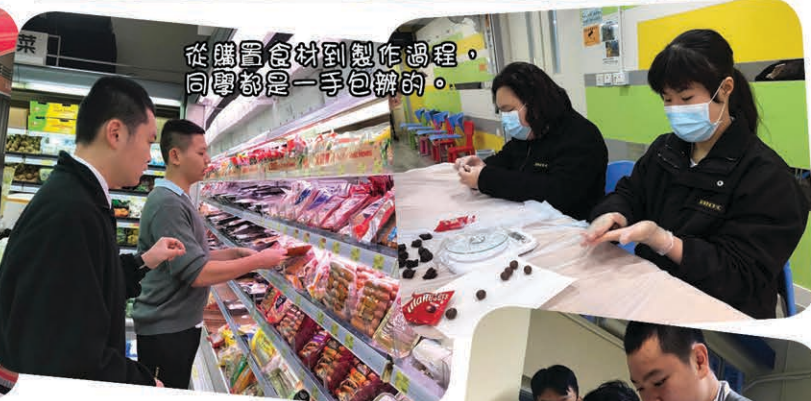
從購置食材到製作過程，同學都是一手包辦的。