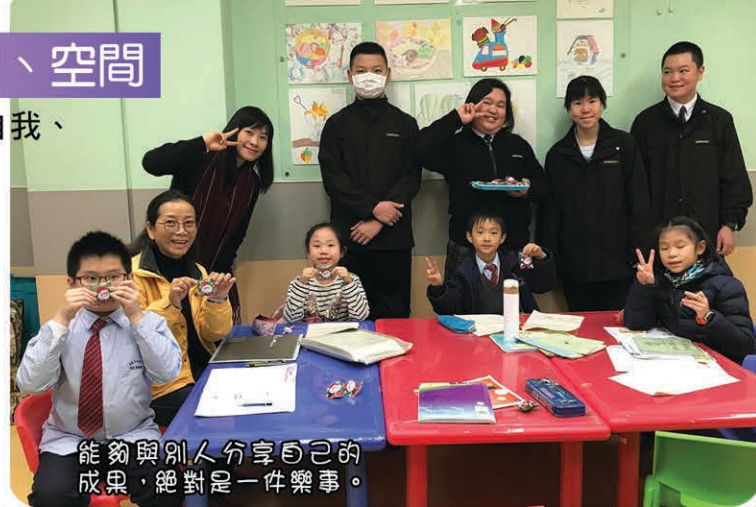
能夠與別人分享自己的成果，絕對是一件樂事。