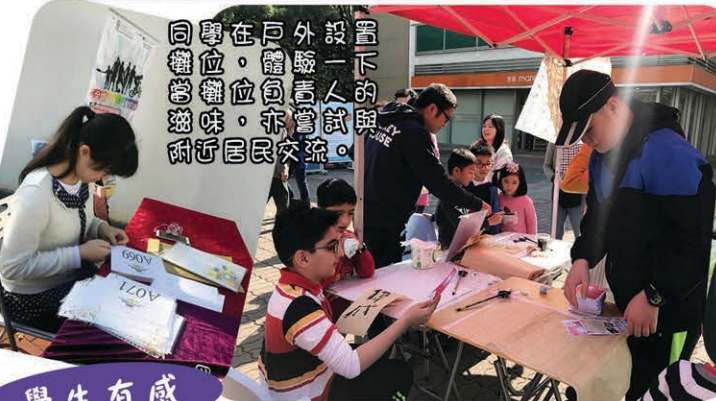
同學在戶外設置的攤位，與附近居民交流。攤位亦充滿了趣味。