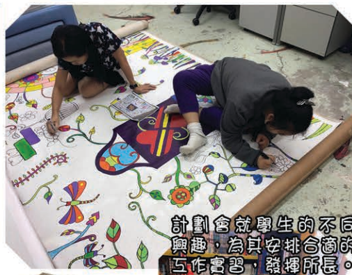
計劃會就學生的不同興趣，為其安排合適的工作實習，發揮所長。

透過「活出豐盛計劃」的一系列活動，包括學生培訓、探訪職業學校、職場走訪及工作實習體驗等，提升同學面對升學及就業規劃的技巧與態度，包括自我認識、發掘強項、建立自信及生涯探究等，為同學在升學及就業方面作好準備。