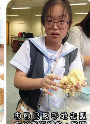
由自己親手地去製作母親節禮物，同學一定很有成就感！