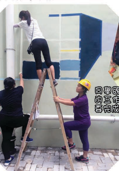
同學既需要適應商生的工作環境，同時亦會完成各項任務。