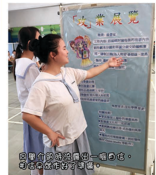
同學介紹時流露出一臉自信，相信早就做好了準備。