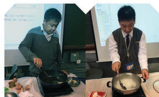
認真的態度、熟練的手勢，看起來很有大廚的風範！