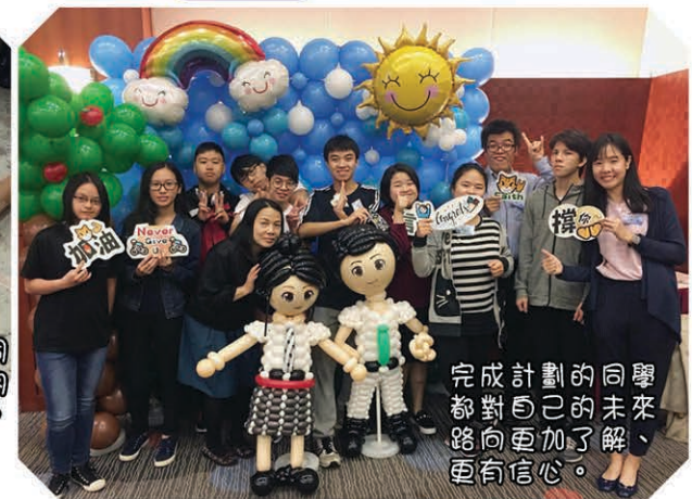
完成計劃的同學都對自己的未來路向更加了解，更有信心。