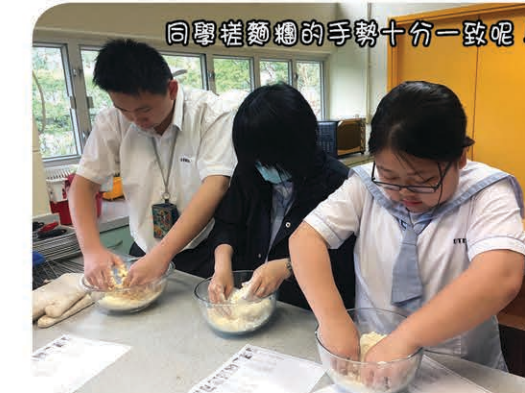
同學搓麵糰的手勢十分一致呢！