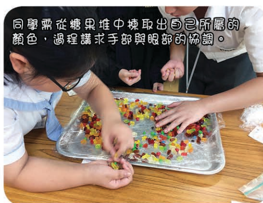
同學需從糖果堆中揀取出自己所屬的顏色，過程講求手部與眼部的協調。