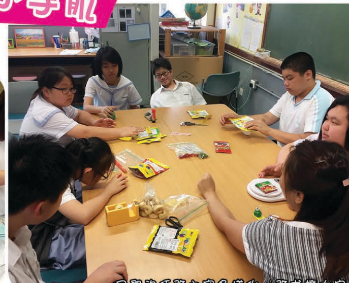
同學的任務內容多樣化，務求讓大家都訓練「十個好朋友」。