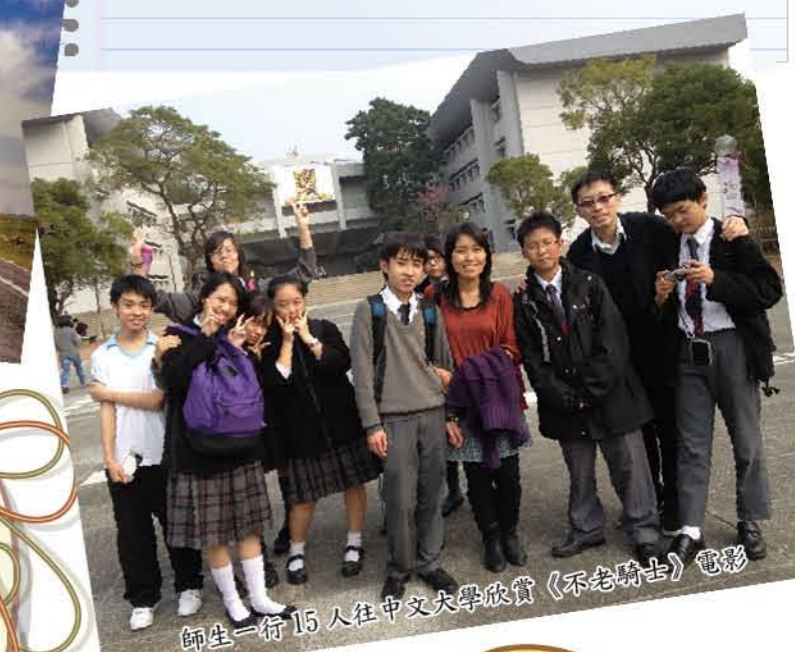
師生一行 15 人往中文大學欣賞《不老騎士》電影

講述 17 位共 1300 歲的老人家，大家為着目標，排除萬難，騎摩托車環島 13 天，征服 1178 公里的紀錄片。