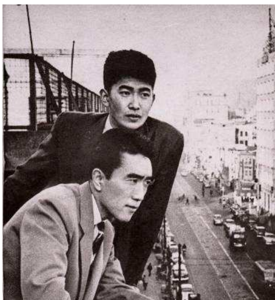
攝於 1956 年，三島由紀夫(前)與現任東京市市長石原慎太郎