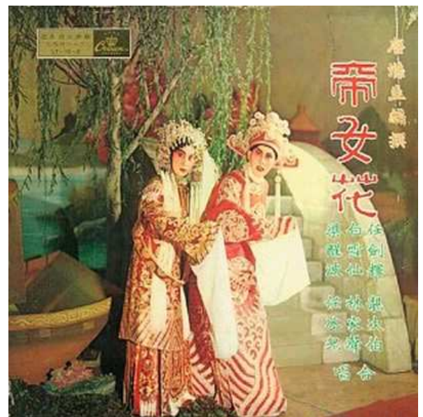
在任劍輝、白雪仙的演繹下，長平公主與周世顯的故事成為粵劇界的殿堂級經典。